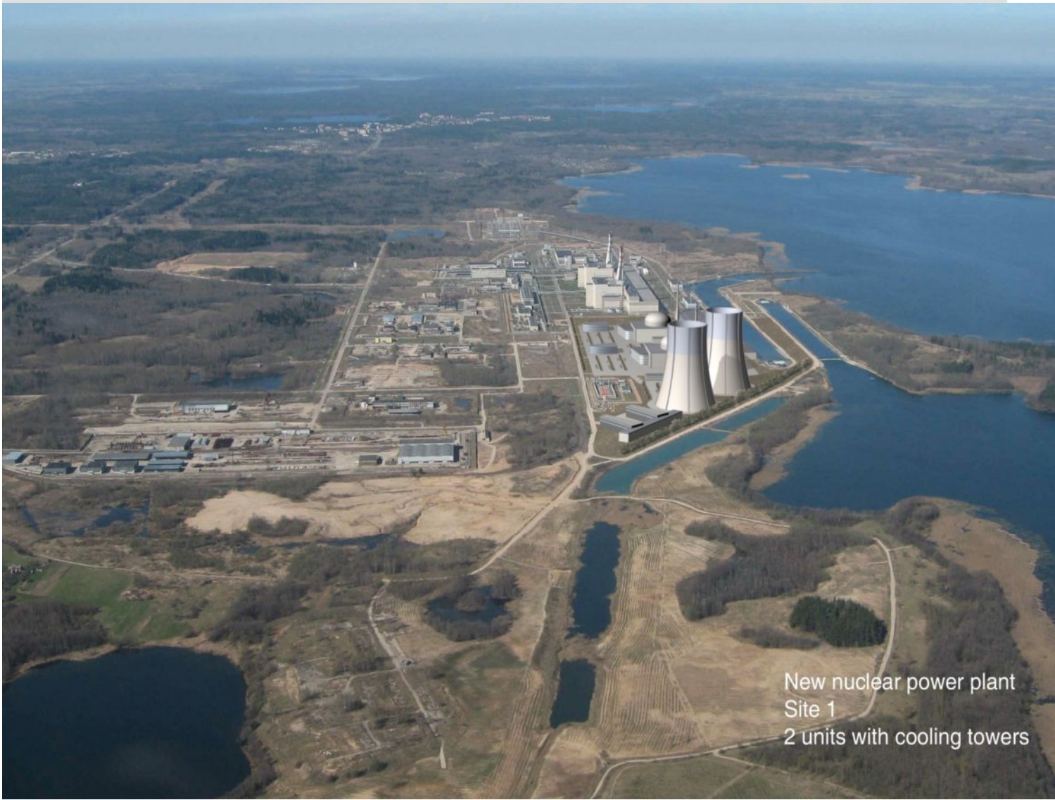
New nuclear power plant Site 1 2 units with cooling towers